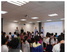
「味の素」の方からの説明・クイズ

か知らなかった児童もたくさんいましたが、今回の見学を通して、仕事に対する見方が変わったように思えます。貴重な体験をさせていただきありがとうございました。味の素社の皆様に感謝申し上げます。