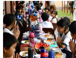
感謝を込めて「いただきます」