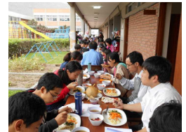
オープンテラスで食欲倍増