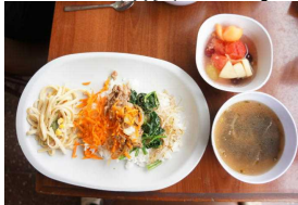
色とりどりの盛りつけ

11月27日(金)は2回目の給食デーでした。メニューは、「ビビンバ丼、わかめスープ、スパゲティーサラダ、フルーツポンチ」。保護者の方々はこの日のために検討を重ねメニューを決定し、材料を揃え、食器を準備し、そして調理と本当に大忙しでした。1階の廊下にテーブル、イスを出し、オープンテラスでの給食でした。ご協力をいただいた保護者のみなさま本当にありがとうございました。