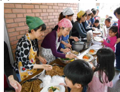
お皿を持って並びます