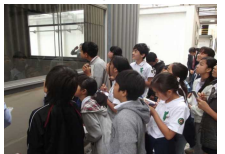
生産工程を窓越しに見学