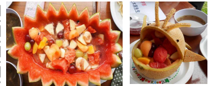
見事なフルーツ盛り

11月28日の土曜授業「わくわくタイム」では、ペルー味の素のカヤオ工場に行きました。日本人スタッフ6人、現地従業員650人の大きな工場です。全体での説明を聞いた後は、2グループに分かれて見学スタートです。味の素の原料が「さとうきび」と聞いてみんなビックリ。そして1分間に1000食のラーメンが作られると聞いてさらにビックリでした。自分の親がペルーでどんなことをしているの