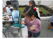
さとうきびを搾る