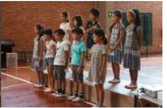
小学部3年101匹わんちゃん