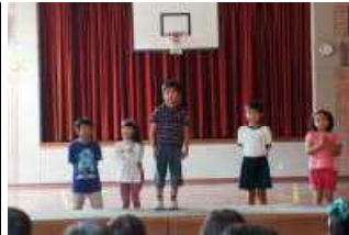
小学部1年自己紹介

<英会話発表会> 2月11日(木)に英会話発表会が実施されました。全学年の児童生徒がそれぞれの学年で趣向を凝らした発表成果を発表です。たくさんの保護者の方々が見守る中、堂々と発表ができました。