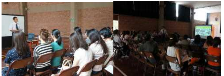
保護者の方々ありがとうございました

<平成28年度教育活動説明会・報告会> 2月11日(木)に教育活動説明会を開催しました。11月に行ったアンケートの結果を基に、今年度の実施報告と次年度の取組の方向性を説明させていただきました。テストや行事の日程の工夫や、縦割り活動について等、貴重なご意見もいただきました。多数のご出席ありがとうございました。