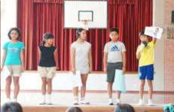
小学部5年手紙を送ろう英語劇