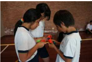
折り紙でひな人形

<平成28年度入学説明会> 1月28日(木)に入学説明会が実施されました。当日は平成28年4月に入学が予定されている未就学者及びその保護者の方への学校紹介、入学手続きの説明、体験授業等が行なわれました。入学及び編入学等は随時受付をしております。ご希望の方はメール等にてご連絡をお願いいたします。