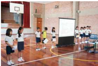
ハミングで「うれしいひなまつり」

<ひなまつり集会、体を動かそう集会> 2月9日(火)に、小学部3年生が担当して、伝統的なひなまつりの紹介や、折り紙で作ったひな人形をさがす宝探しゲームなどをしました。体を動かそう集会では、保健体育委員会が中心となって、全員でだるまさんが転んだと大縄跳びを楽しみました。