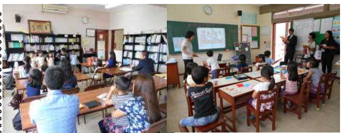
小学部1年生からの歓迎のあいさつ

<平成28年度入学説明会> 1月28日(木)に入学説明会が実施されました。当日は平成28年4月に入学が予定されている未就学者及びその保護者の方への学校紹介、入学手続きの説明、体験授業等が行なわれました。入学及び編入学等は随時受付をしております。ご希望の方はメール等にてご連絡をお願いいたします。