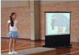
小学部4年詩の朗読