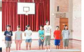
中学部パラカスや諸外国紹介

<ひなまつり集会、体を動かそう集会> 2月9日(火)に、小学部3年生が担当して、伝統的なひなまつりの紹介や、折り紙で作ったひな人形をさがす宝探しゲームなどをしました。体を動かそう集会では、保健体育委員会が中心となって、全員でだるまさんが転んだと大縄跳びを楽しみました。