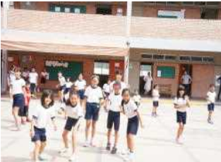
だるまさんが転んだ

<平成28年度教育活動説明会・報告会> 2月11日(木)に教育活動説明会を開催しました。11月に行ったアンケートの結果を基に、今年度の実施報告と次年度の取組の方向性を説明させていただきました。テストや行事の日程の工夫や、縦割り活動について等、貴重なご意見もいただきました。多数のご出席ありがとうございました。