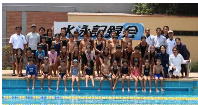
水泳記録会終了後にみんなで記念撮影 (水泳記録会の様子は3月号で紹介します。)

私たち学校職員も「出来そうもない。」とか「難しい。」と考えず、もう一歩先の学校を目指し、子供たちの成長に負けないよう努力してまいります。