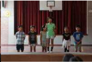
小学部2年自己紹介