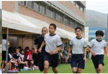
中学部男子、瀬崎先生も一緒に