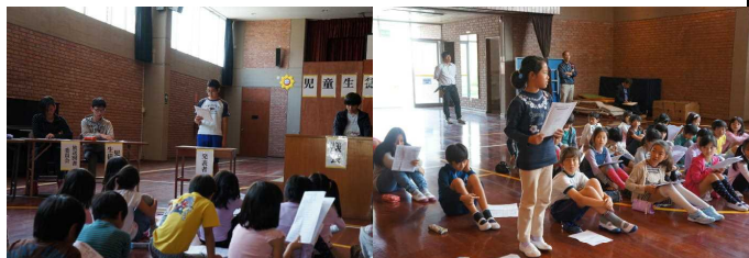
新役員による議事進行

小学1年生から中学3年生まで、全校児童生徒で、後期の児童生徒総会を行いました。新役員で、意見交換を行いました。新役員で、意見交換を行いました。新役員で、意見交換を行いました。