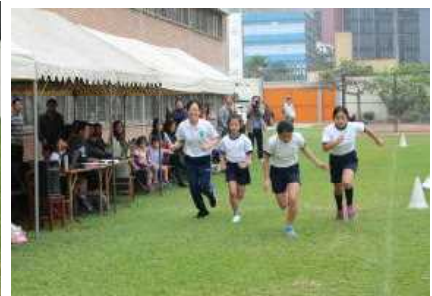
記録目指して 6年生女子