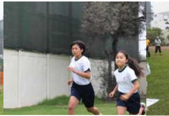
中学部女子のスタート