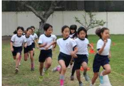
みんな全力 3・4年生