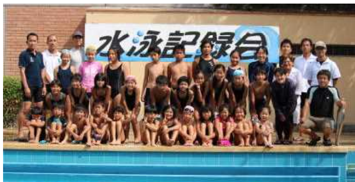
水泳記録会終了後にみんなで記念撮影

この時だからこそ、この3年をあるいは1年を振り返る。自分を見つめる。多くの人に支えられながら今日まで歩んできたことに感謝と喜びを。明日からもまたきっとよき日が続くであろう事を確信して、明るく伸び伸びと進んでもらいたいものです。人生の「節」をきちんと作り上げることこそ、これからのエネルギーとならずだと思っています。