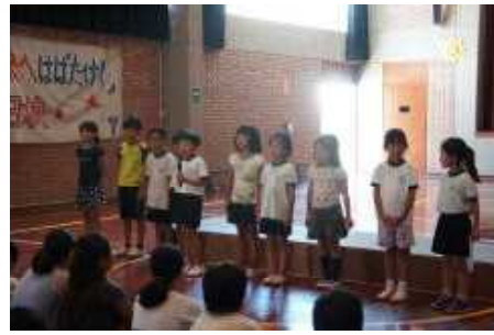
「BASICO」と「AVANZADO」の中で工夫を凝らして発表を行いました。

<スペイン語発表会> 2月7日(火)にスペイン語発表会が実施されました。各学年の児童生徒が学習の成果を発表しました。発表の場をもち、保護者の方々の前で発表することができました。