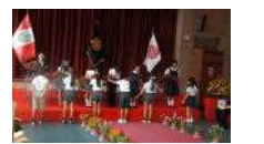
在校生から花束贈呈