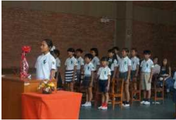
在校生からの別れの詩