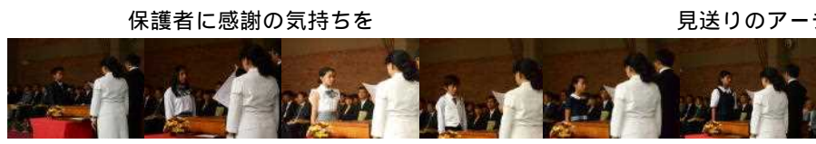
保護者に感謝の気持ちを