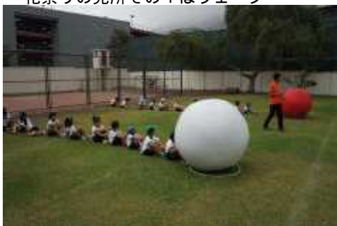
自分より大きい大玉に四苦八苦