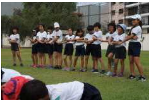
花祭りの見所その1はウェーブ

5月27日(土)に運動会が開催されます。それに向けて38名の子どもたちは毎日、一生懸命練 習をしています。今回で49回目を迎える本校の運動会、全校で踊る「花まつり」も3年目となり今 回までとなりました。小学部1年生は入学してからの練習にもかかわらず、立派に、リズムカルに踊 りの練習を頑張っています。応援合戦では、赤組も白組も秘密練習を繰り返しています。本番では練 習の成果を十分発揮して、観客を魅了して欲しいと思います。 ご来賓の皆様、保護者の皆様、どうぞお越してください。そして子どもたちの頑張りを是非ご覧ください い。運動会の写真は次号に掲載しますのでお待ちください。