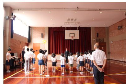
3学期始業式 1月7日(月)

さて、学校は7日に3学期がスタートしました。3学期は授業日数が45日間とたいへん短い学期ですが、子どもたちはこの間に現学年1年間の総まとめをすることになります。「終わり良ければ全てよし」となるよう、一人一人が有終の美を飾ってくれることを期待しています。